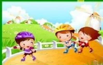
прогулки на свежем воздухе